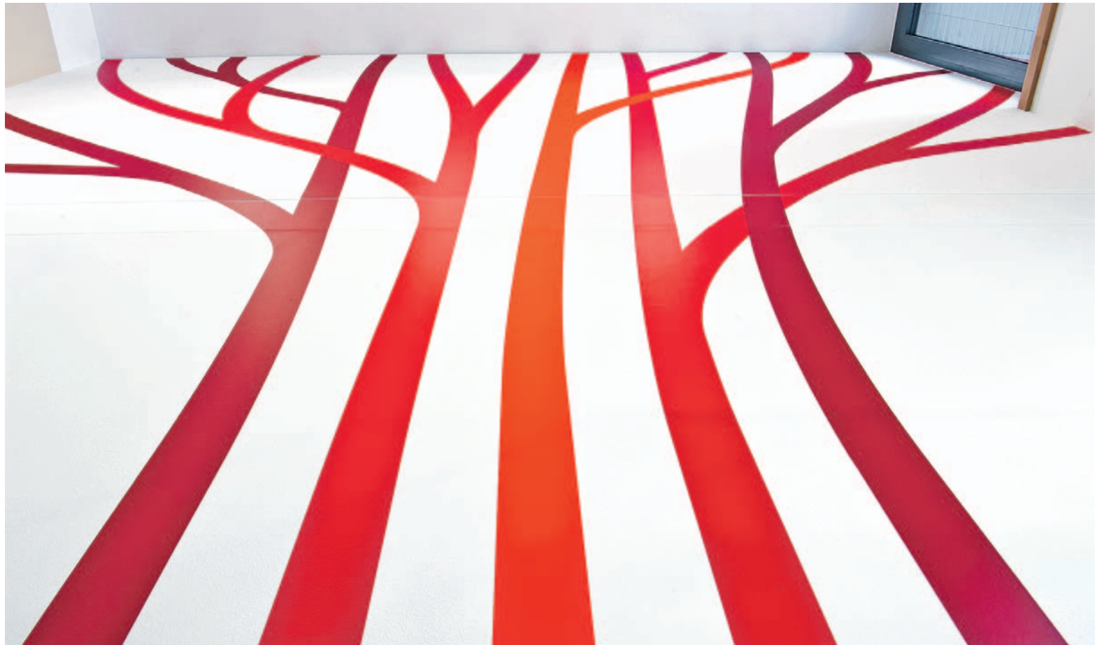
Lebensadern als Orientierungssystem vom Büro Perndl & Co. für das Bildungszentrum der Wiener Stadtwerke.

www.recommendedusers.com Mittlerweile dürfte die Facebook-Community ihre schlaflosen Nächte mit dem Abwägen der Argumente für oder wider einen Umzug zu Google+ zubringen. Wer sich dort schon herumtreibt, bekommt von „Recommended Users“ die wichtigsten Netzwerk-Freunde vorgeschlagen. Es gibt verschiedene Kategorien, eine davon ist Venture Capital und Business Angels.