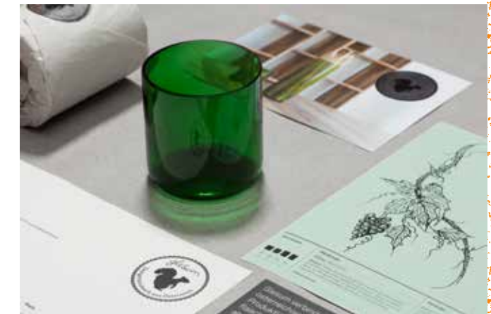
↓ 03 Die Weingläser zeichnen sich durch ihre Form und Stabilität aus. KUNDE: glesum The wine glasses are characterized by their shape and stability. CLIENT: glesum